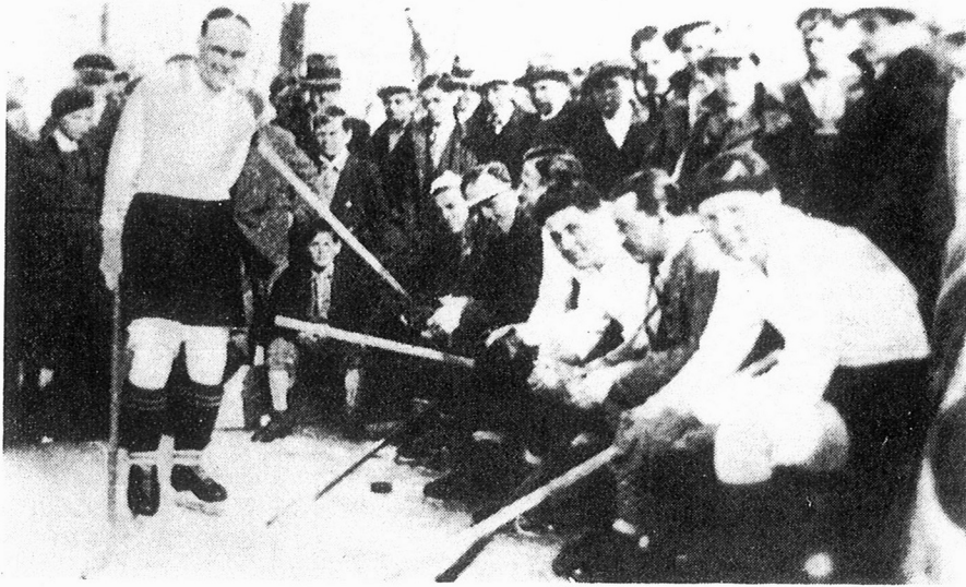
Marathonovi igrači za vrijeme predaha